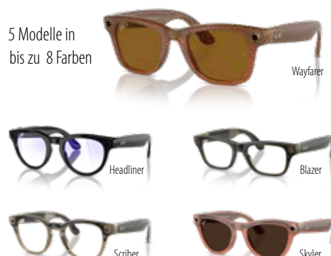
5 Modelle in bis zu 8 Farben

Für wen? Ästhetiker und Trendsetter, die Design lieben.